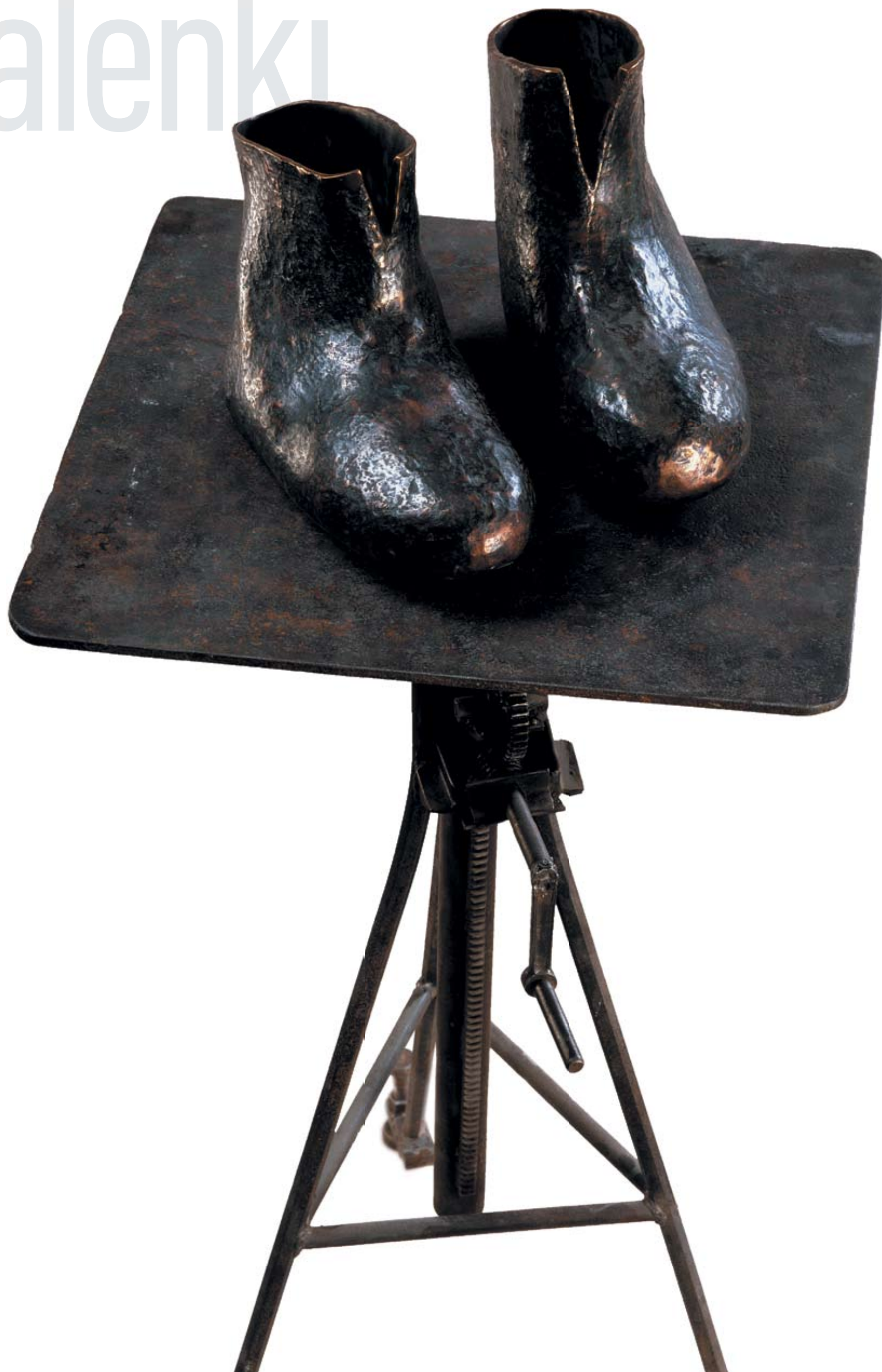
Валенки. 2001 Бронза. 23x29x32 см Valenki. 2001 Bronze. 23x29x32 cm