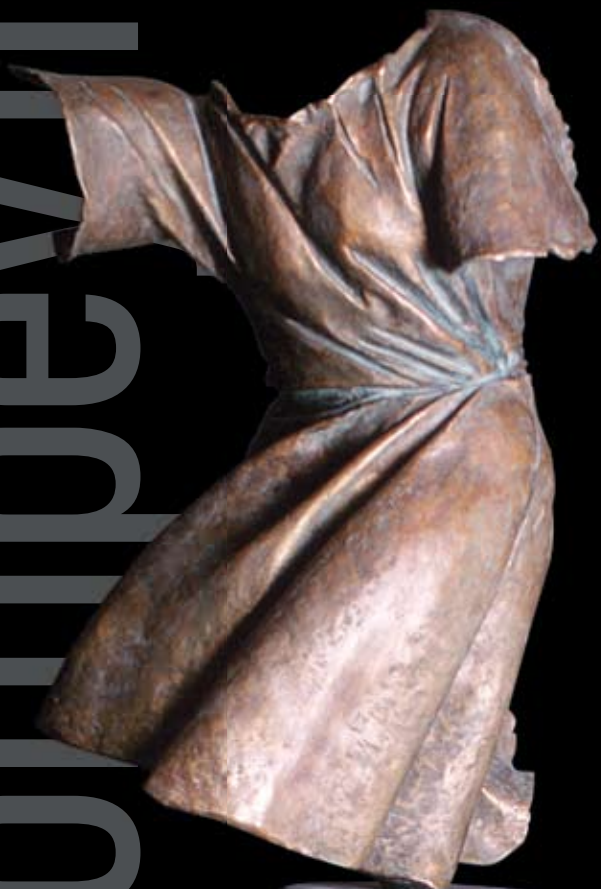
Последний день Помпеи II. 1998 Бронза, камень. 235x55x38 см Last Day of Pompey II. 1998 Bronze, stone. 235x55x38 cm