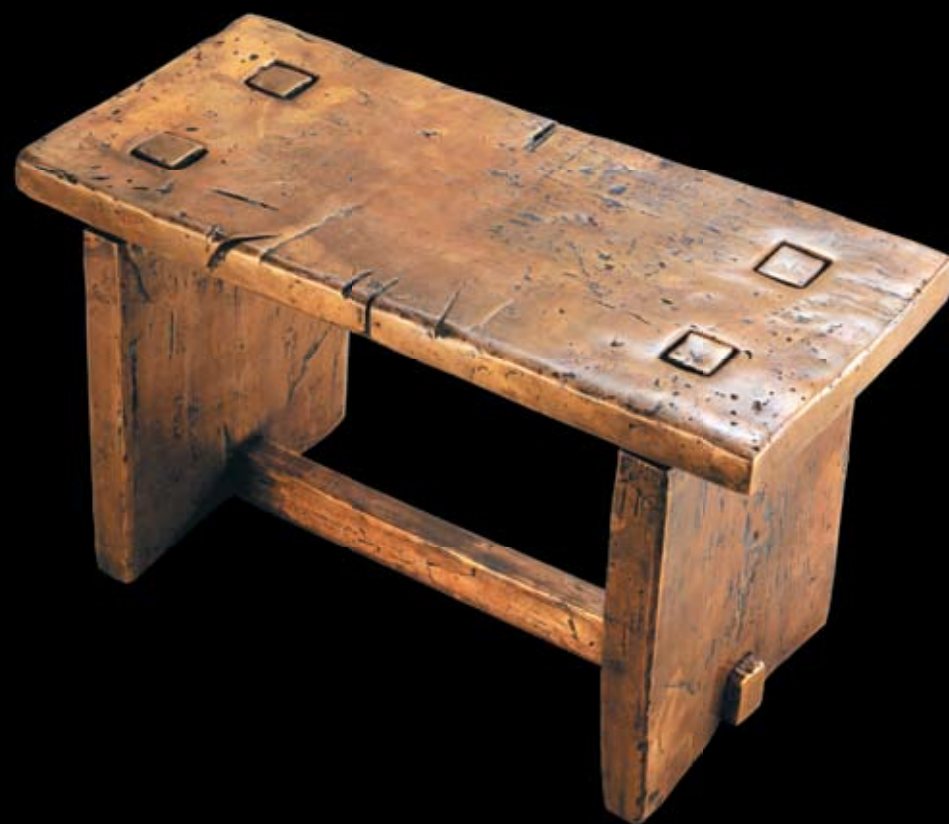
Скамейка. 2001 Бронза. 22,5x38x18 см Bench. 2001 Bronze. 22,5x38x18 cm