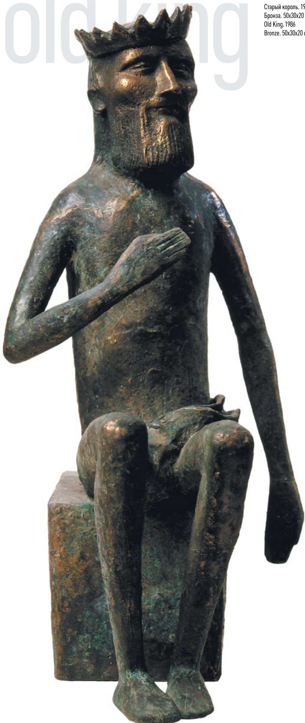
Старый король. 1986 Бронза. 50x30x20 см Old King. 1986 Bronze. 50x30x20 cm