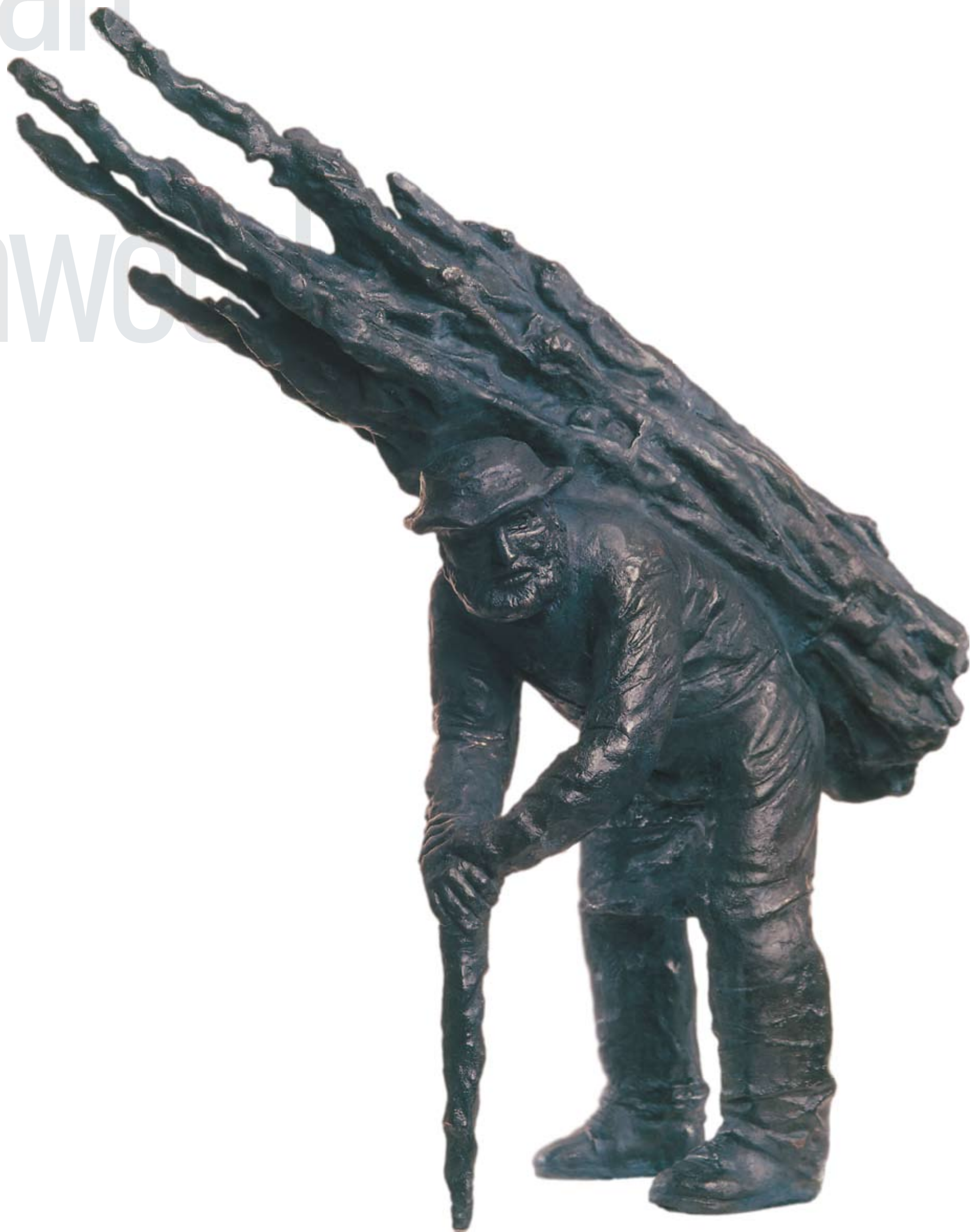
Старик с хворостом. 1987 Бронза. 50x15x50 см Old Man With Brushwood. 1987 Bronze. 50x15x50 cm