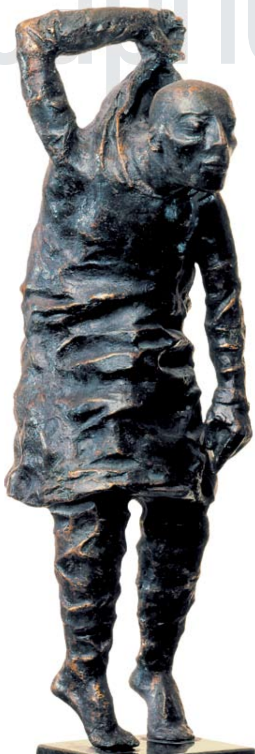
Капричиос. 1986 Бронза. 70x15x20 см Capriccios. 1986 Bronze. 70x15x20 cm