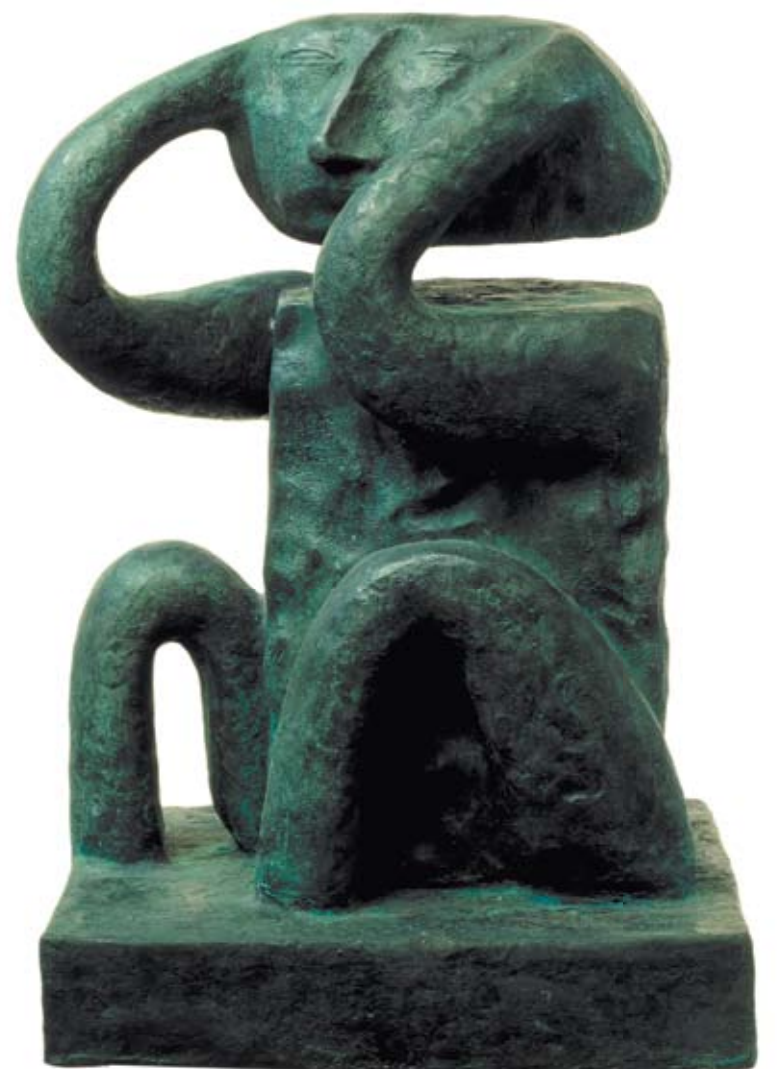
Похмелье. 1992 Бронза. 38x20x23 см Hang-over. 1992 Bronze. 38x20x23 cm