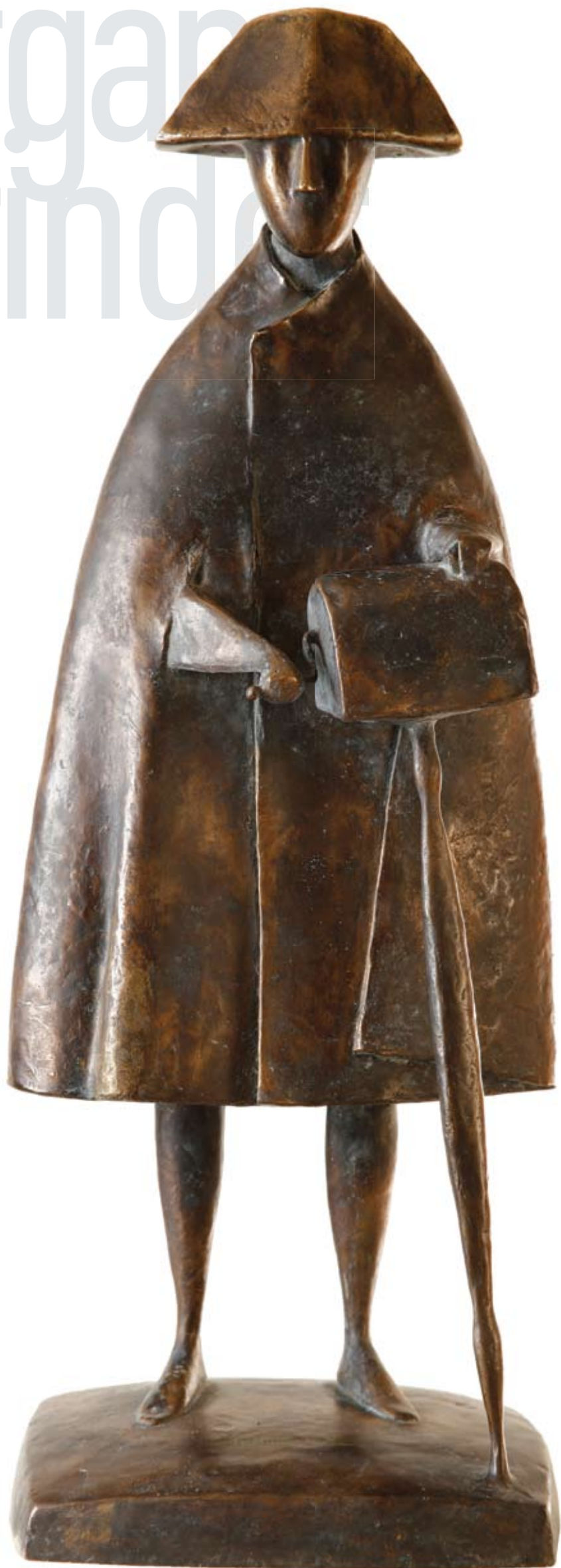
Шарманщик. 2000 Бронза. 57x22x19 см Organ-grinder. 2000 Bronze. 57x22x19 cm