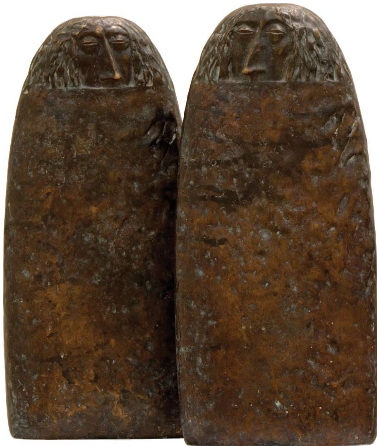
Амулет. 1989 Бронза. 65x30x10 см Amulet. 1989 Bronze. 65x30x10 cm