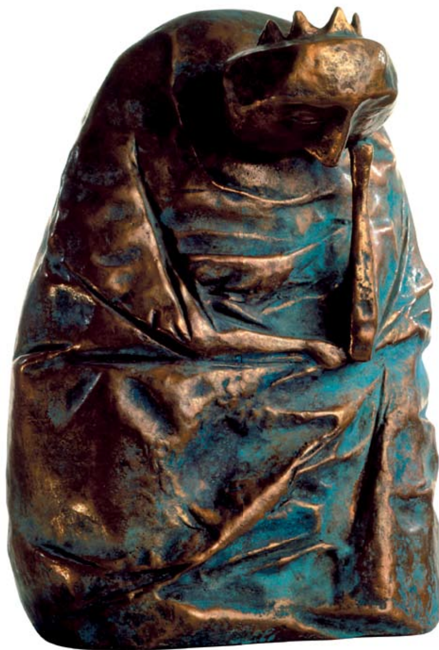
Грустный король. 1987 Бронза. 35x15x20 см Sad King. 1987 Bronze. 35x15x20 cm