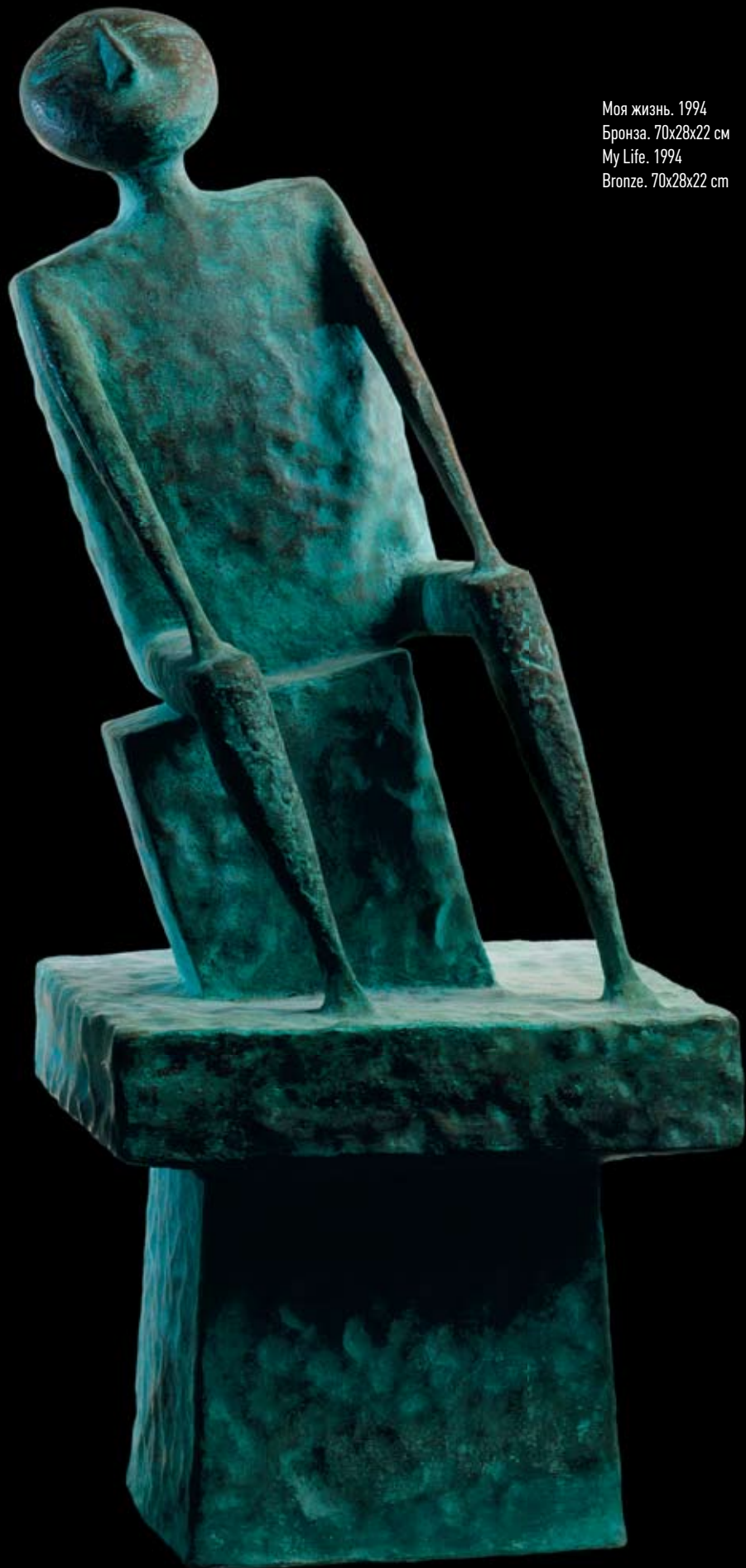
Моя жизнь. 1994 Бронза. 70x28x22 см My Life. 1994 Bronze. 70x28x22 cm