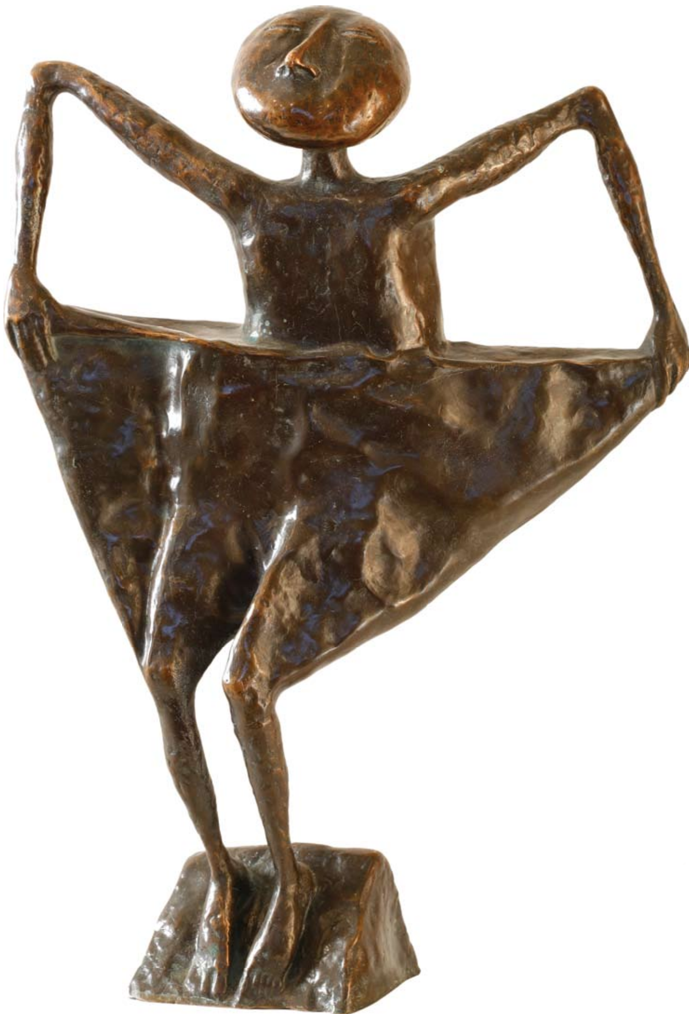
Лето. 1996 Бронза. 35x25x7 см Summer. 1996 Bronze. 35x25x7 cm