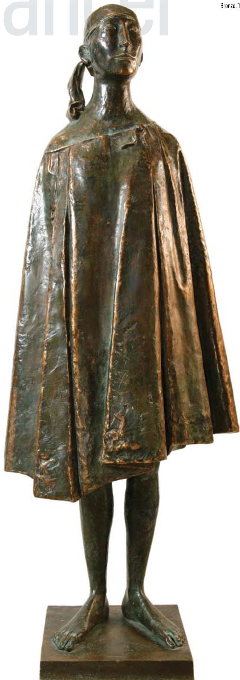
Танцовщица. 2001 Бронза. 161x60x35 см Dancer. 2001 Bronze. 161x60x35 cm