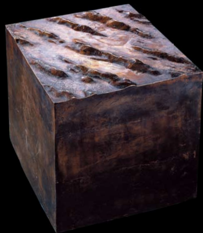
1 \text{ km}^3 \text{ H}_2\text{O} . 2005 Бронза. 37x37x37 см 1 \text{ km}^3 \text{ H}_2\text{O} . 2005 Bronze. 37x37x37 cm