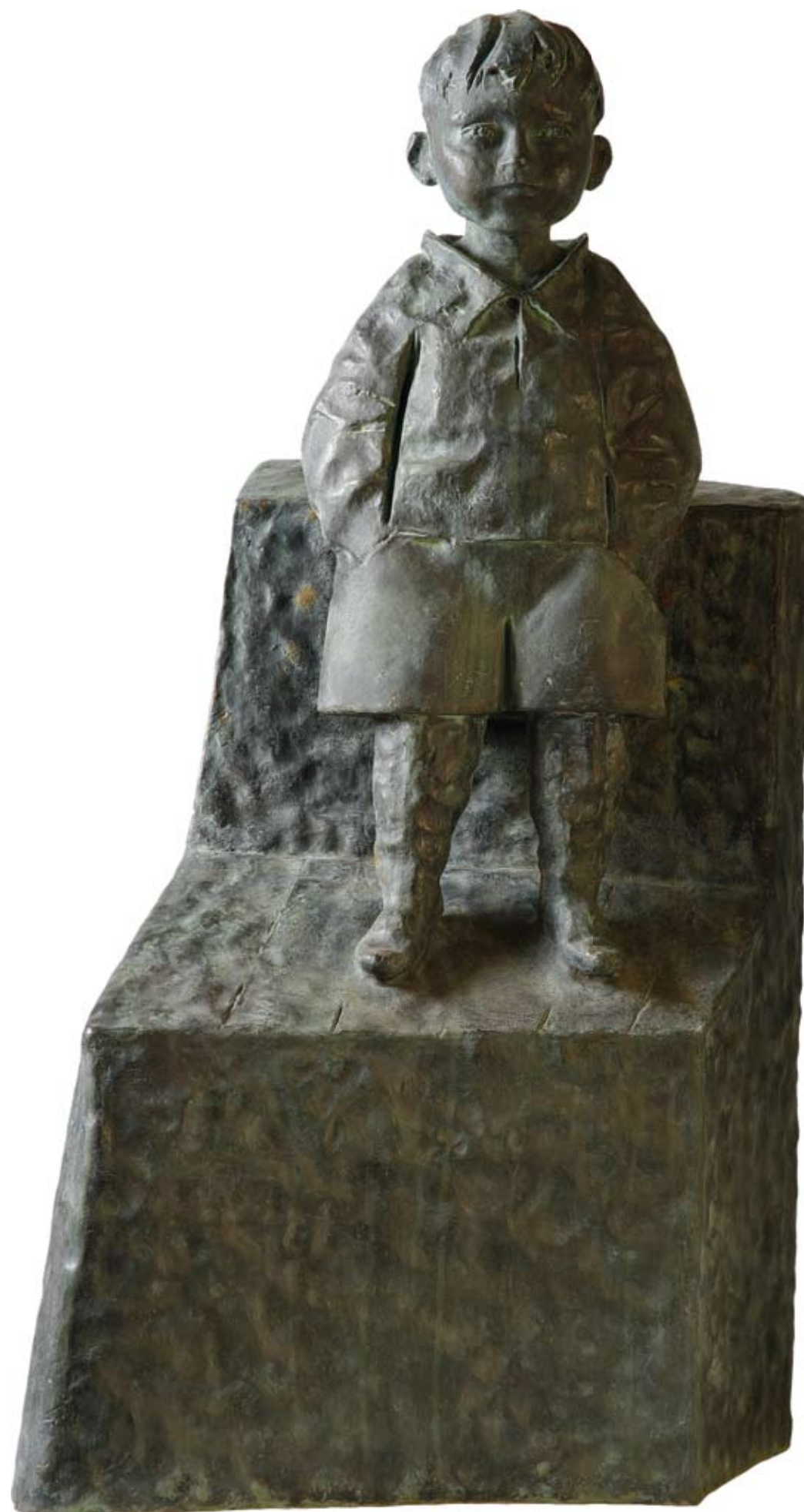
Мальчик на стуле. 2006 Бронза. 120x64x45 см Boy On the Chair. 2006 Bronze. 120x64x45 cm