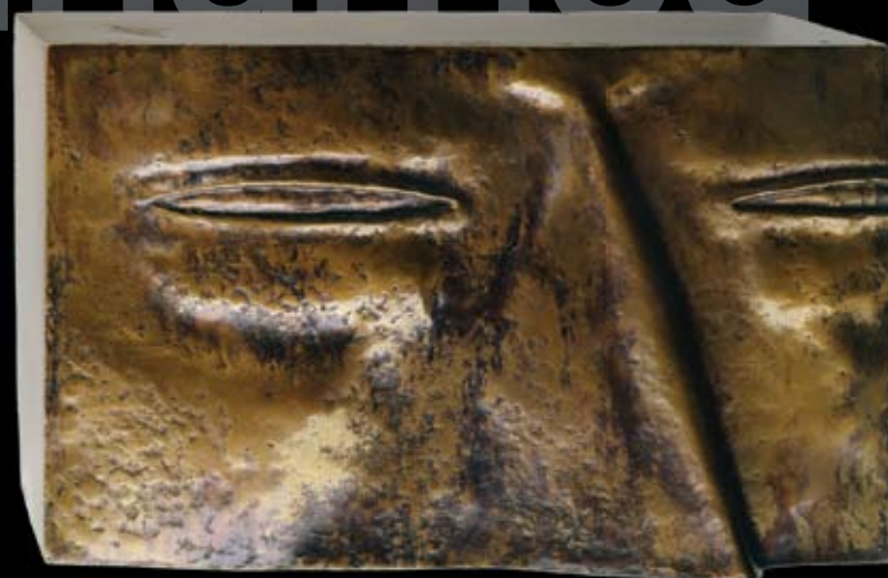
Портрет (фрагмент). 2004 Бронза. 17x26x7,5 см Unnamed (Fragment). 2004 Bronze. 17x26x7,5 cm