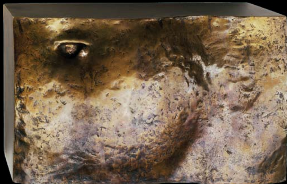
Обнаженная (Фрагмент). 2004 Бронза. 16,5x26,5x8 см Unnamed (Fragment). 2004 Bronze. 16,5x26,5x8 cm